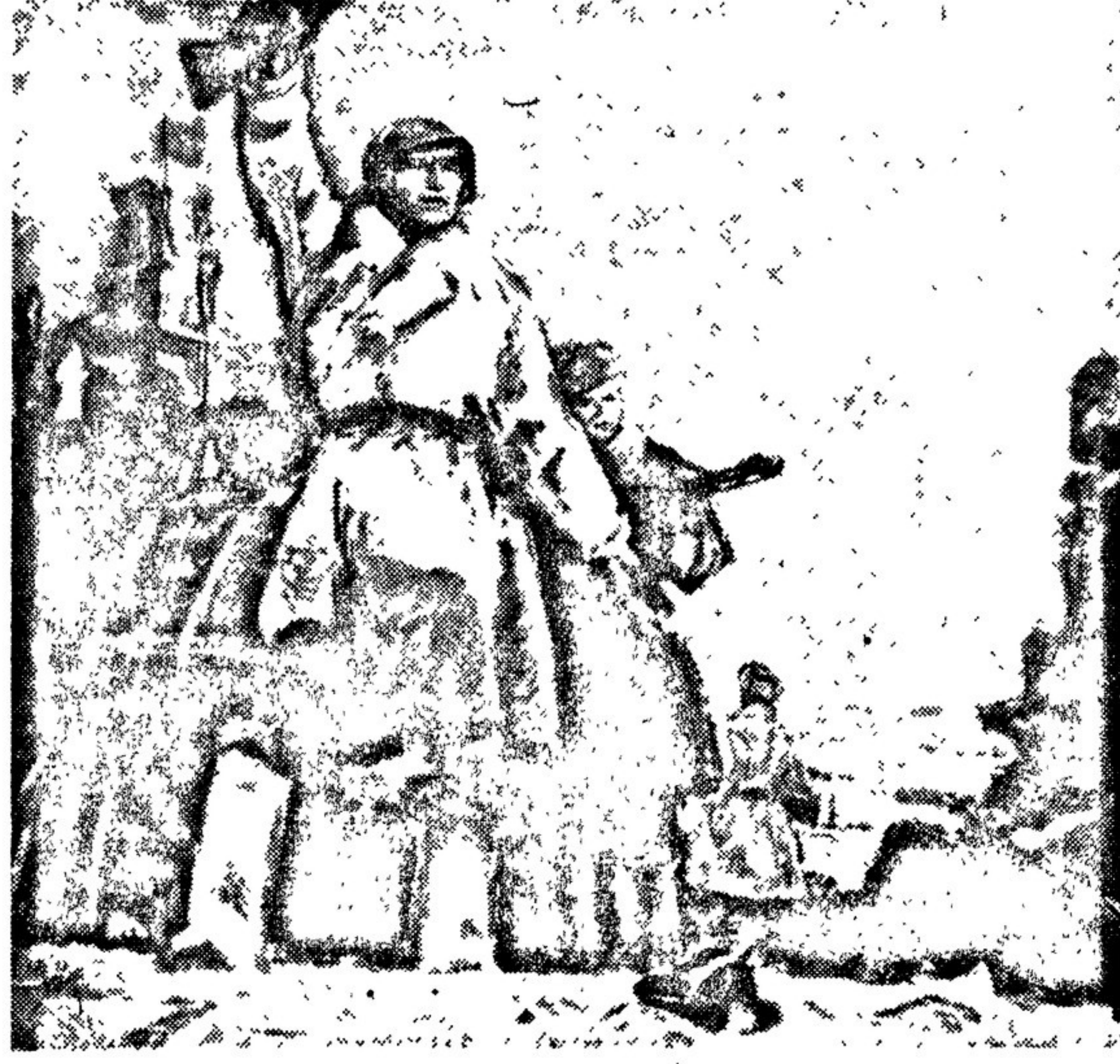
«Сталинград наш». Пастель Л. ШМАРИНОВА. Выставка «Красная Армия в борьбе с немецко-фашистскими захватчиками».

Центральный Комитет Всесоюзной Коммунистической Партии (большевиков).