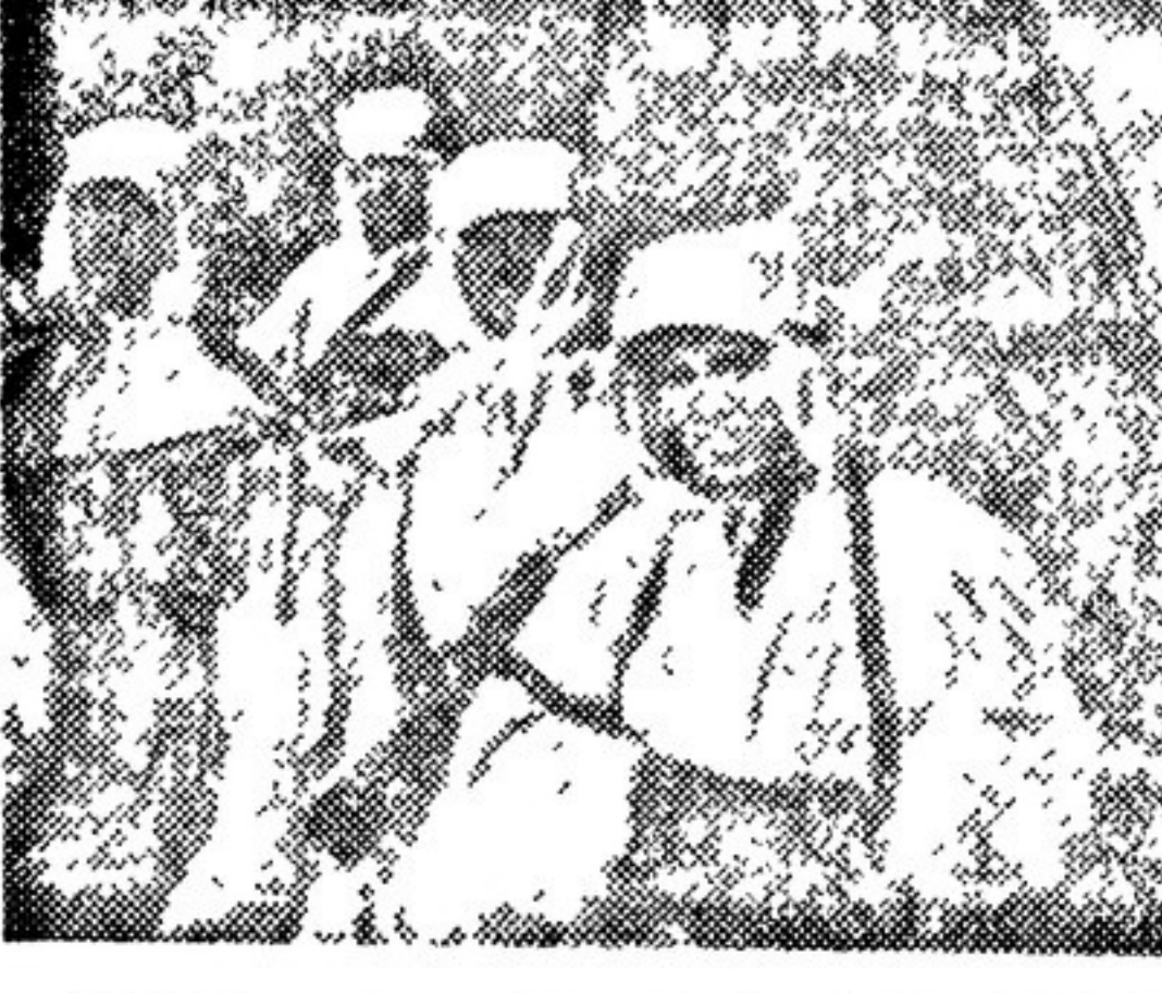
Кадры из фильма «Сталинград». Вверху: жители Сталинграда выходят из бомбоубежища. В центре: группа пленных немецких солдат и офицеров. Внизу: бойцы-автоматчики на торжественном митинге, посвященном разгрому немецко-фашистских войск в районе Сталинграда.