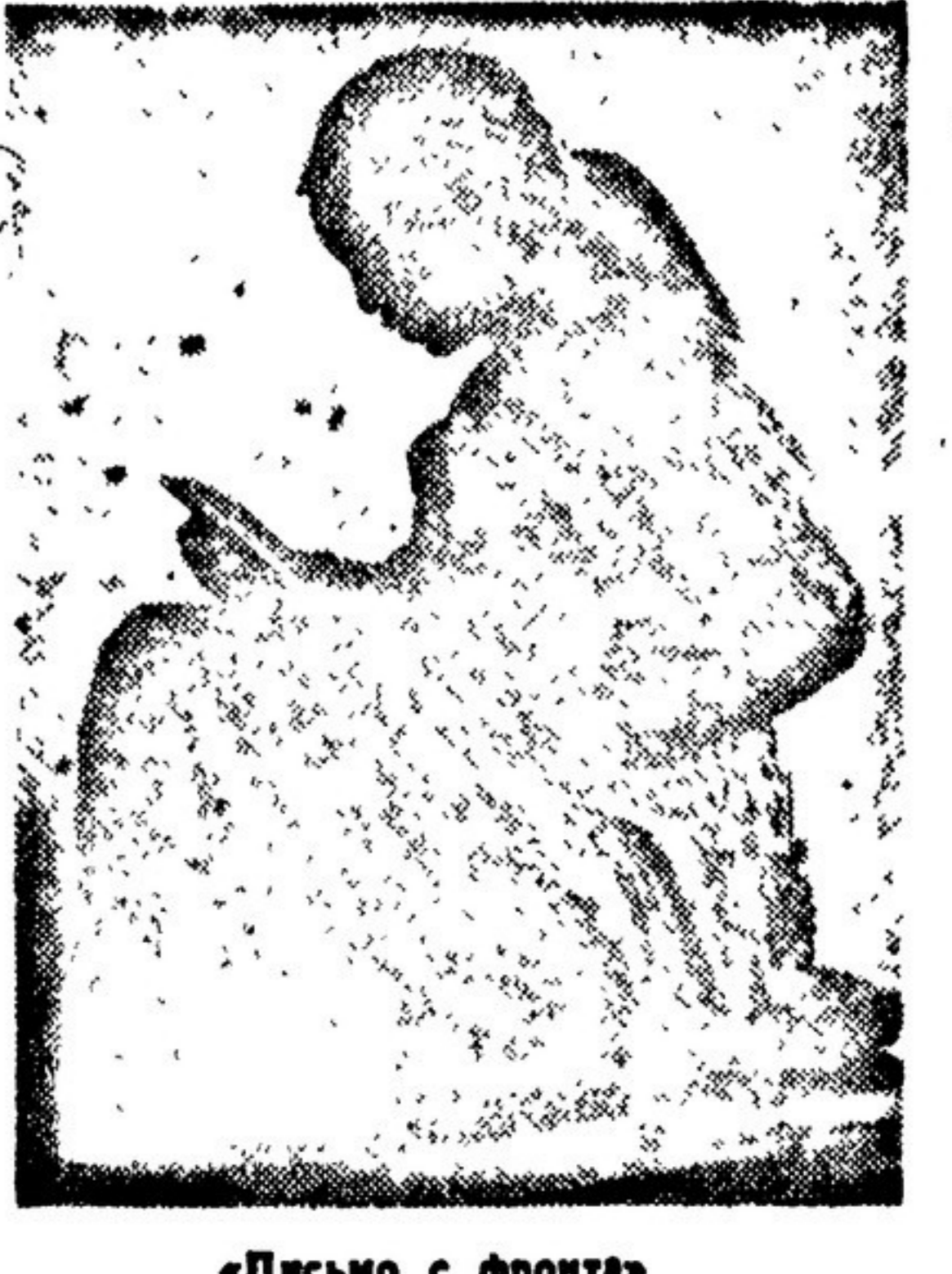
«Письмо с фронта» Культурная композиция М. ОШИТЦИНА. г. Фрунзе.

Ничего или очень мало. Остается детей Сибири, Урала, Дальнего Востока, Средней Азии, а также тех, что эвакуированы на прифронтовой полосе, оставлять их без книжного воспитания никак невозможно.